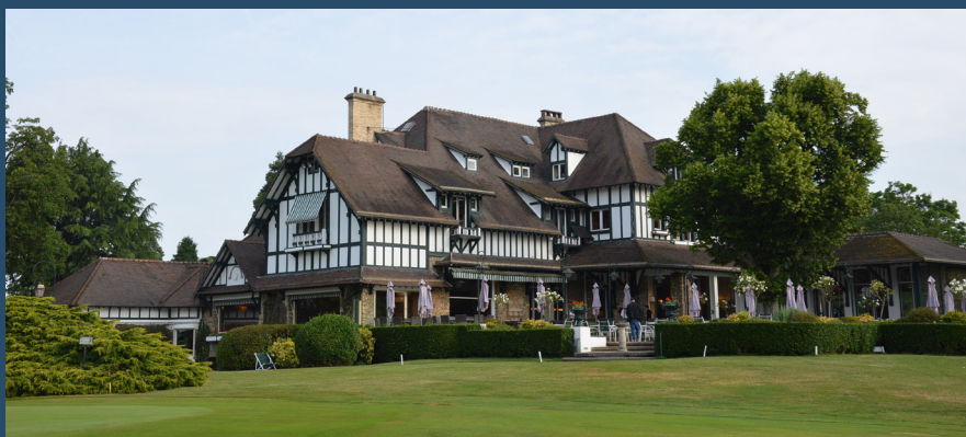
GOLF DU RCF LA BOULIE