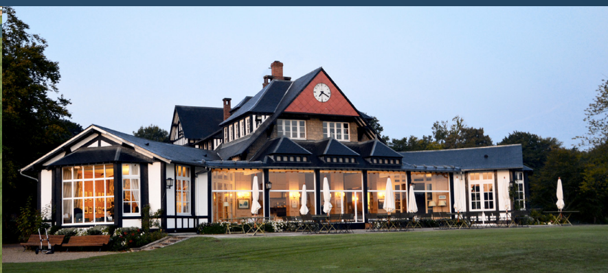
GOLF DE CHANTILLY