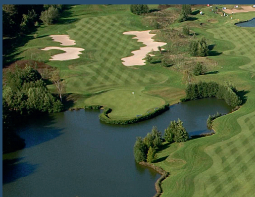
EXCLUSIV GOLF DE COURSON